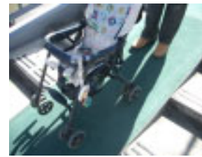
歩道橋をベビーカーで利用

エレベーターは1分30秒ほど待つので、急いでいるときはオススメできません。地下に降りるために東棟に行く必要がある時は、2つもエレベーターに乗るのでとても時間がかかってしまいます。利用者は屋間でも多く、高齢の方、ベビーカーをもつママに限らず、一般の方も利用されています。内部は2組の親子がベビーカーをたたまず利用できるくらいの広さです。