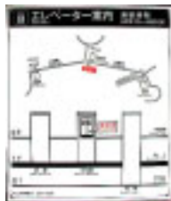
エレベーター案内図

エレベーター付きの歩道橋は、階段を上らずに行きたいときにはぜひ利用したいもの。北歩道橋にはエレベーターが3台ありますが、地下鉄につながっているのは、東棟のみです。北歩道橋と南歩道橋も上部でのつながりがなく東西への移動しかできません。迷わないように気をつけて利用しましょう。